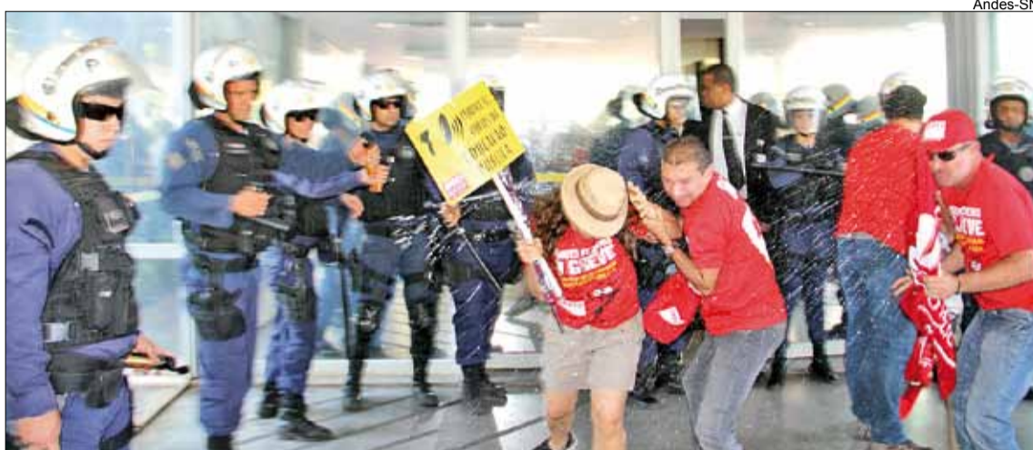
Enquanto um grupo ocupava o gabinete do ministro Janine Ribeiro, outros professores realizaram ato em frente ao MEC. Eles sofreram repressão por parte da polícia militar

Em seguida, os manifestantes dirigiram-se ao Ministério da Educação (MEC). Um grupo de 16 docentes do Comando Nacional de Greve (CNG) do Andes-SN ocupou o gabinete do ministro Janine Ribeiro por volta das 13h para cobrar uma audiência – Janine é o primeiro ministro da Educação a não receber o Sindicato Nacional em