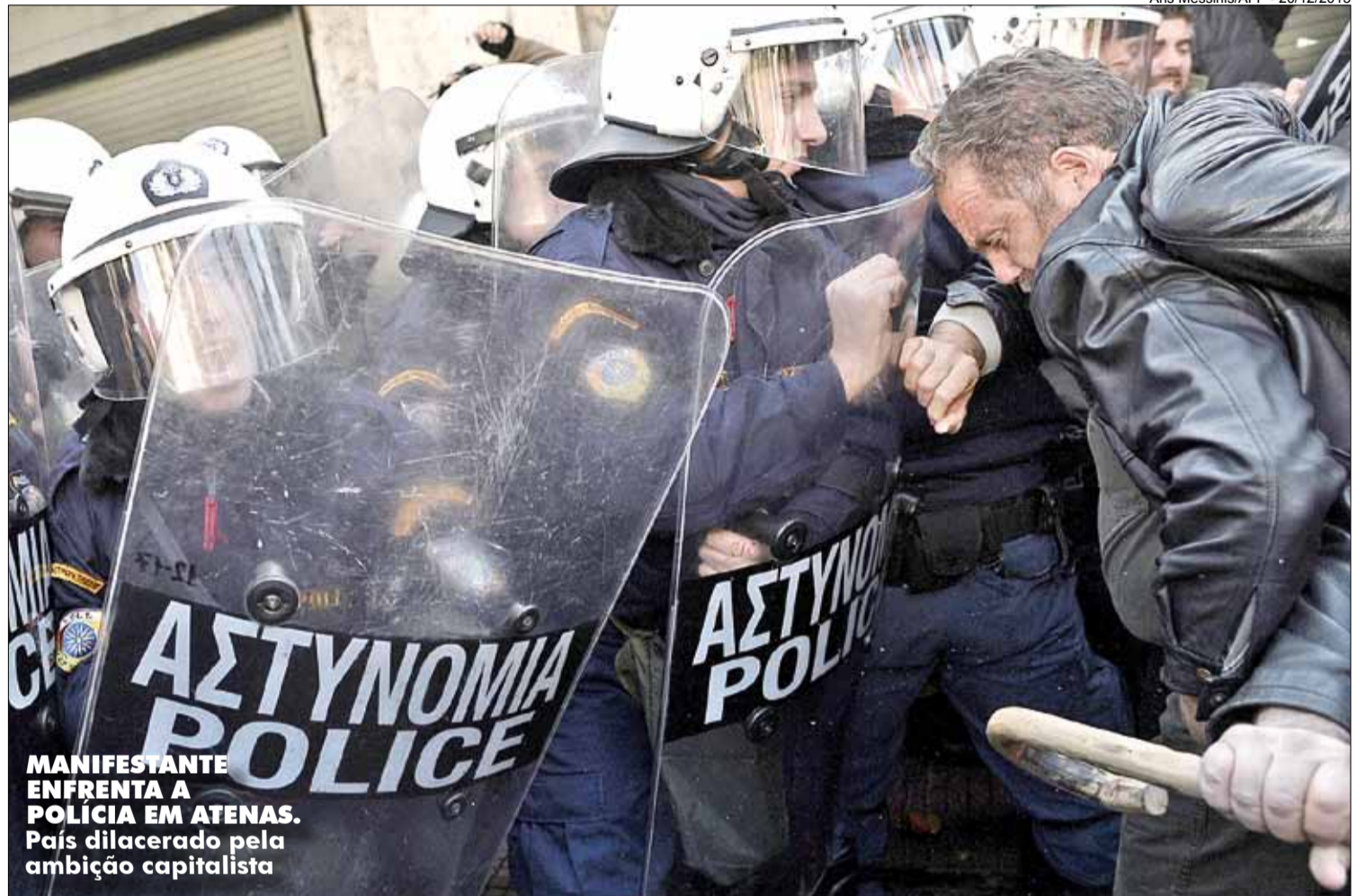
MANIFESTANTE ENFRENTA A POLÍCIA EM ATENAS. País dilacerado pela ambição capitalista