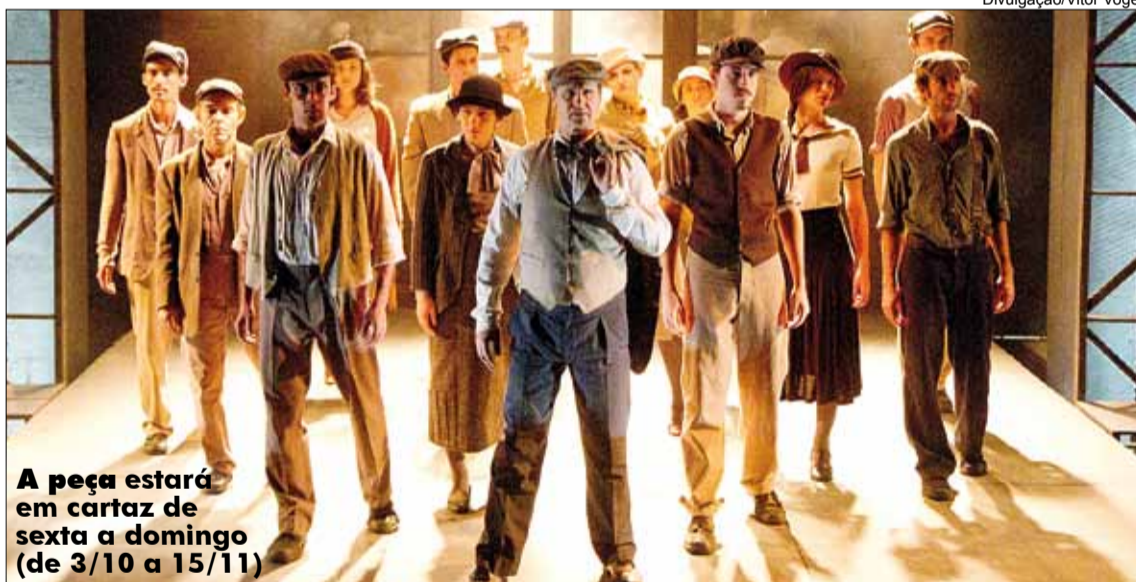
A peça estará em cartaz de sexta a domingo (de 3/10 a 15/11)

O sapateiro Nicola Sacco e o peixeiro Bartolomeu Vanzetti foram acusados pelos assassinos de um contador e do guarda de uma fábrica. E, mesmo após a confissão do crime por outro homem em 1925, os dois foram condenados, sem provas, à morte e executados na cadeira elétrica em 1927. O fato gerou intensas mobilizações na época. Somente em 1977, o governo do estado de Massachusetts admitiu