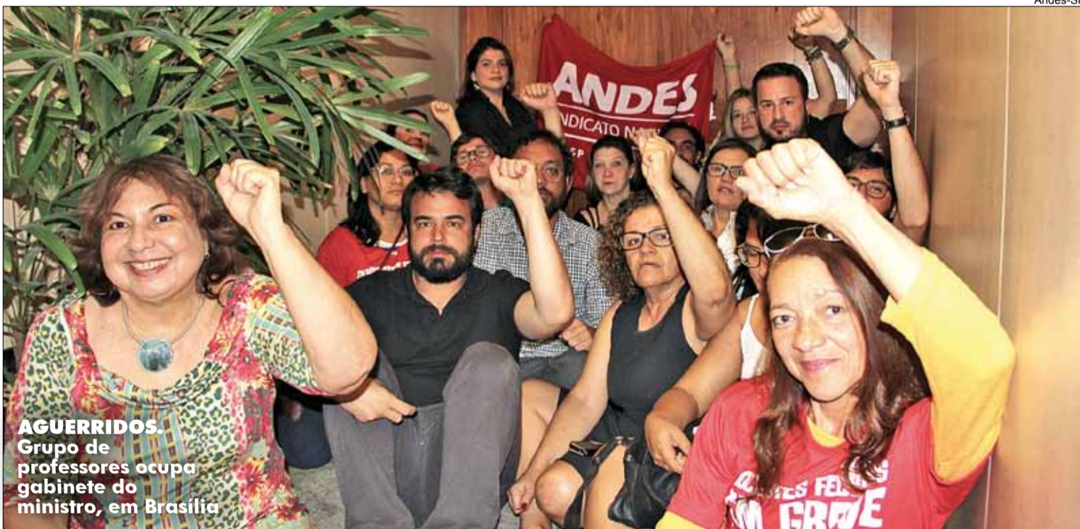
AGUERRIDOS. Grupo de professores ocupa gabinete do ministro, em Brasília

Um grupo de professores ocupou o gabinete do ministro da Educação na tarde de quinta-feira 24, em Brasília (DF). A pressão deu resultado e o MEC agendou para 5 de outubro audiência de representantes do movimento docente com Renato Janine Ribeiro. O secretário de Relações do Trabalho do Ministério do Planejamento, Sérgio Mendonça, também prometeu receber os professores nos próximos dias.