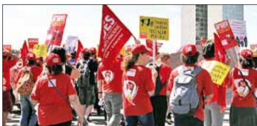
Marcha dos servidores em Brasília

Em mesa setorial com os professores, governo não apresenta nenhuma novidade em relação ao apresentado na segunda-feira.