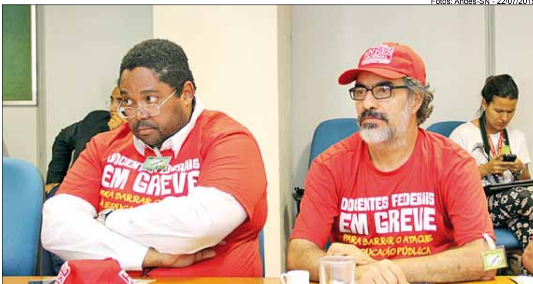
Professores rejeitam proposta de reduzido aumento parcelado pelos próximos quatro anos

“Nós reafirmamos o conteúdo da reorganização conceitual da nossa carreira, com o qual o MEC teve acordo no ano passado e que agora insiste em não reconhecer. No entanto, não apresenta outra proposta. Não apresenta nada. E como vamos avançar na negociação se eles não apresentarem quais são suas ideias e qual o recurso que eles vão disponibilizar para isso? Sabemos que há recursos”, completou.