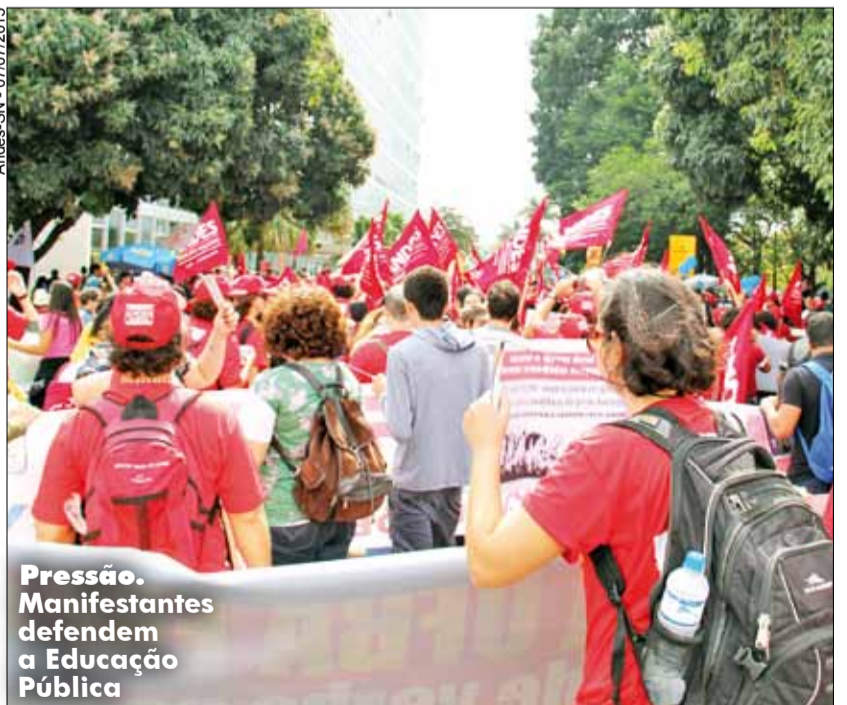
Pressão. Manifestantes defendem a Educação Pública

Ato conjunto de todos os segmentos da UFRJ: 16 de julho, quinta-feira, às 10h (previsão), na Cinelândia. Atividade antecede manifestação contra os cortes no orçamento. Comunicado do CLG na página 2.