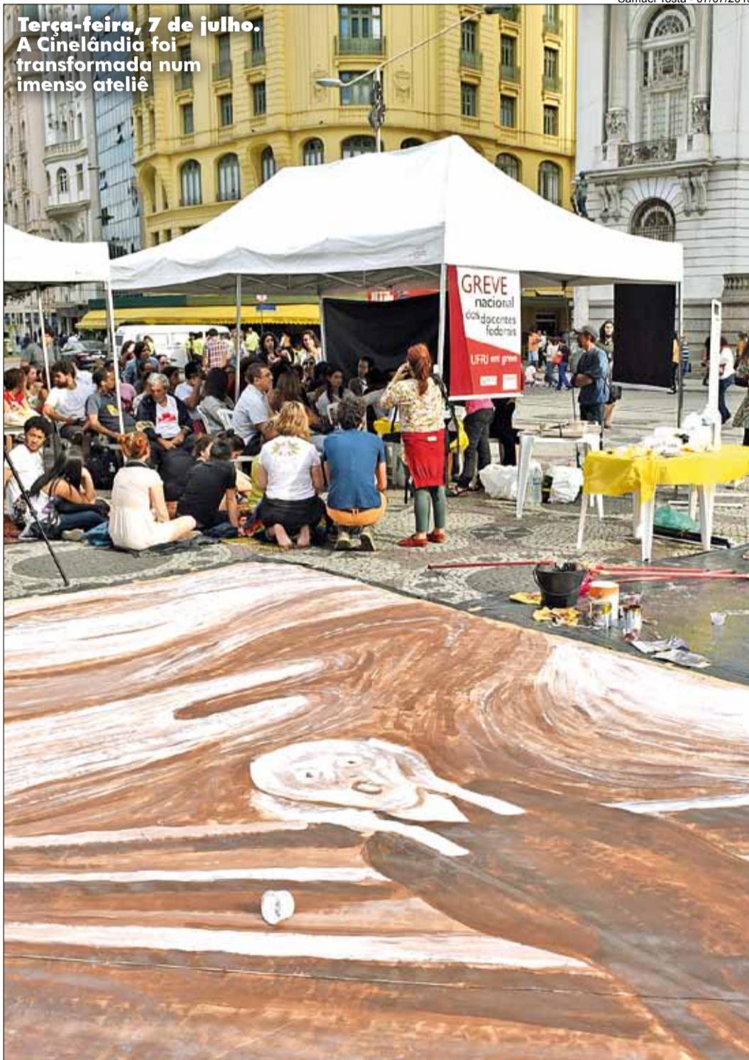
Terça-feira, 7 de julho. A Cinelândia foi transformada num imenso ateliê