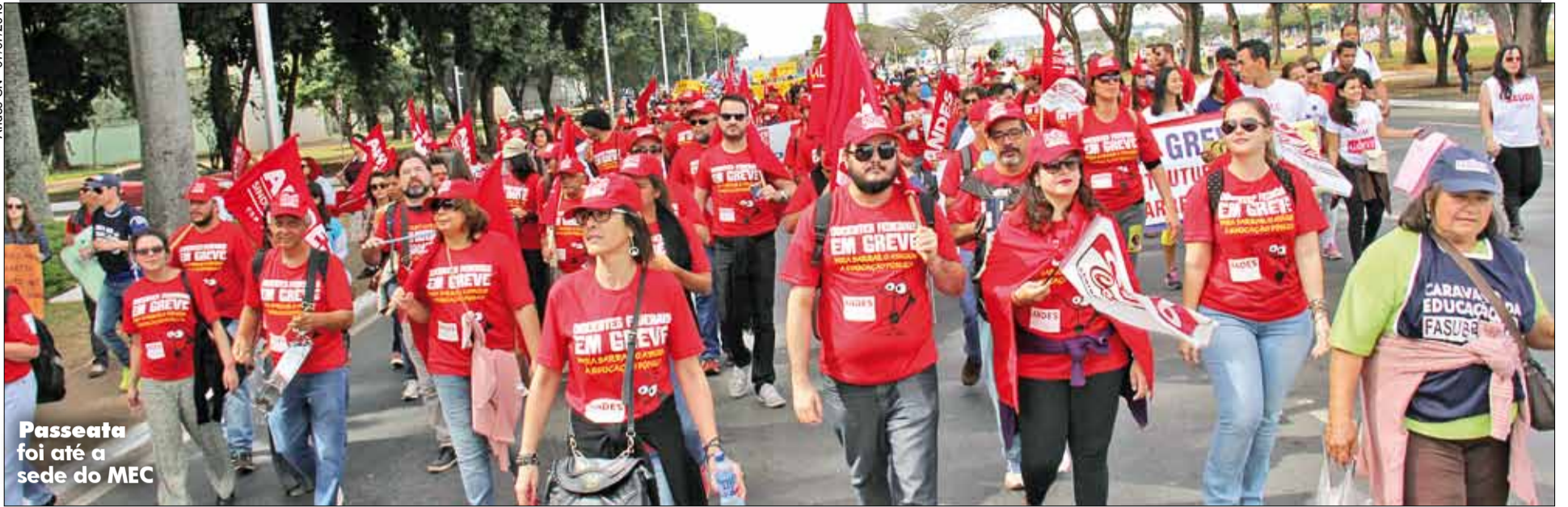
Andes-SN - 07/07/2015 Passeata foi até a sede do MEC