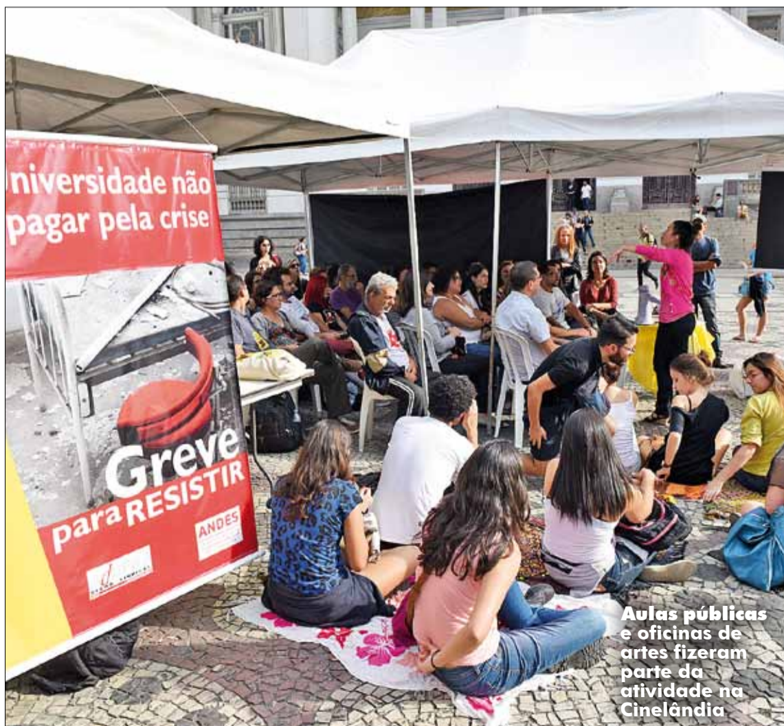
Aulas públicas e oficinas de artes fizeram parte da atividade na Cinelândia

■ Confira vídeo sobre esta atividade de greve no site www.adufrj.org.br .