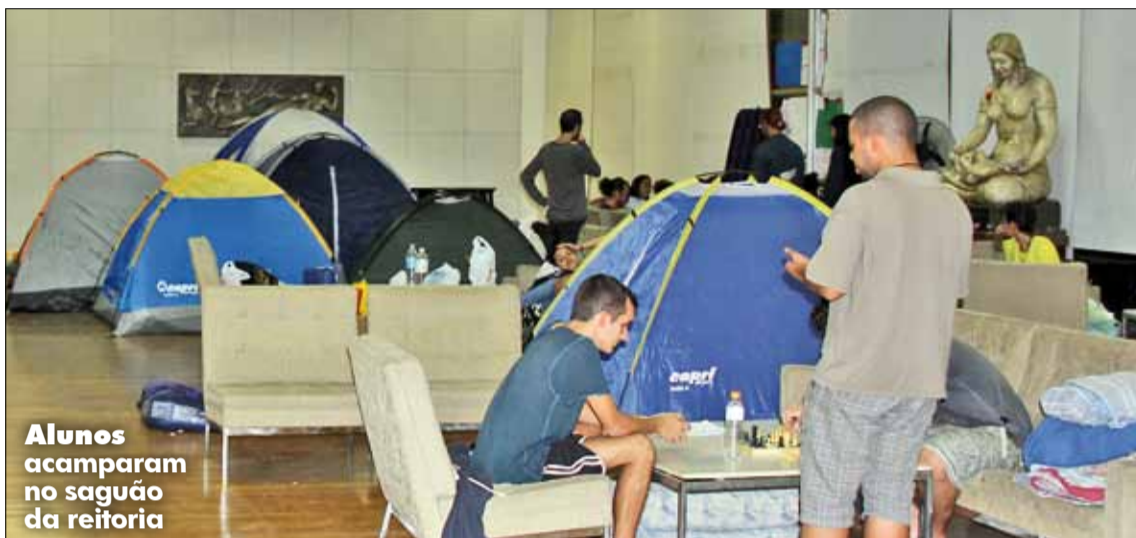
Alunos acamparam no saguão da reitoria