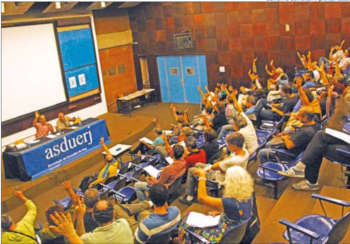
Guilherme Schneider/Imprensa Asduerj

A universidade sofre com o contingenciamento que, em março, já alcançava R$ 91 milhões. Com a retenção orçamentária, a crise dos serviços terceirizados (assim como na UFRJ) estourou com força na instituição. Os banheiros acumulam sujeira e cartazes foram espalhados para denunciar o descaso com os trabalhadores. Mutirões de alunos e profes-