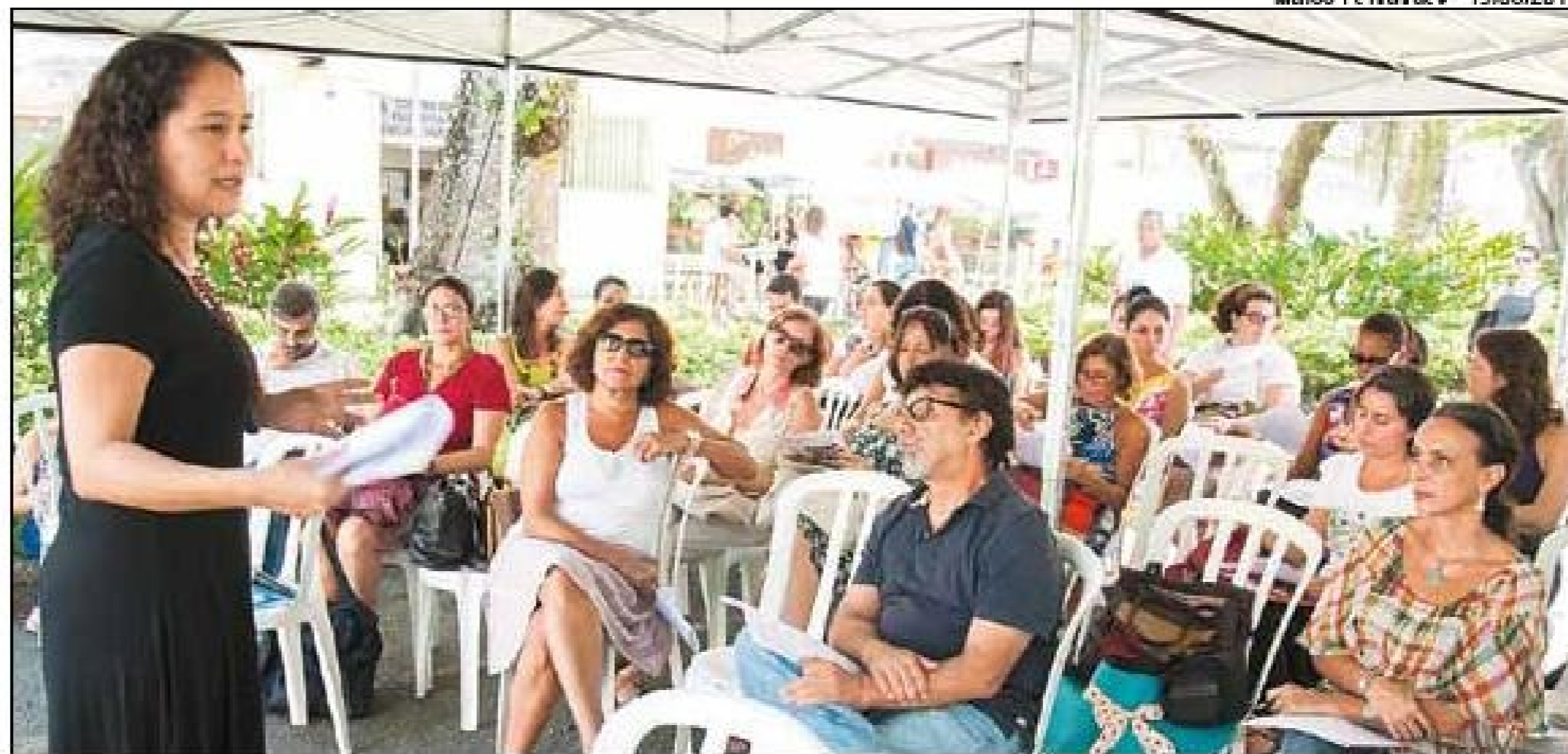
Equidade. Professores discutem critérios para avanço na carreira que não criem distorções