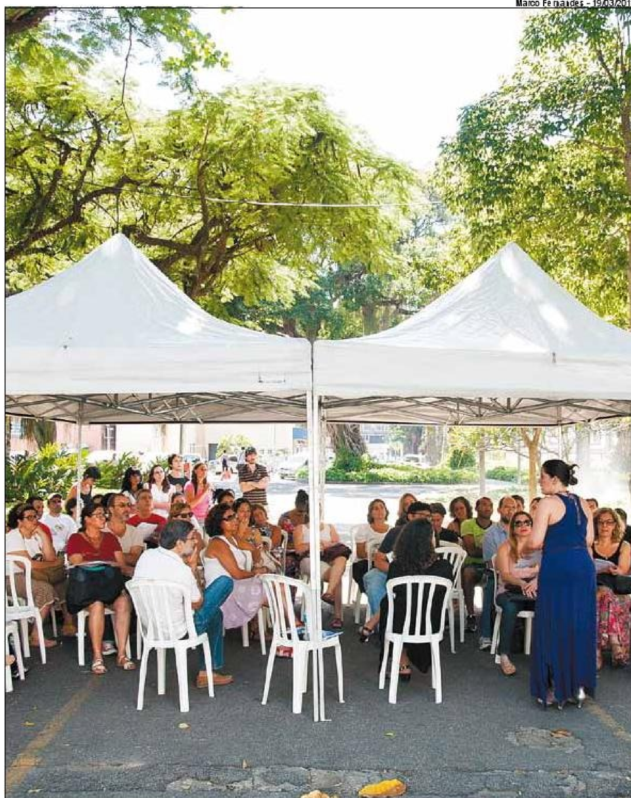
Federais. Professores trocam avaliações sobre resultados das mobilizações de 2012. Agenda comum do funcionalismo pouco avançou em função de mesas de negociação por categoria

Para Iasi, o cenário de 2014 é de reflexão sobre os avanços reais conseguidos no movimento de 2012, mas também de avaliação das “energias necessárias para superar os entraves apresentados pelo governo” e para “uma negociação real”. “Não estamos falando de uma questão meramente financeira, mas de política para Educação e demais serviços públicos”. “O conflito entre uma política de superávit fiscal versus qualidade no atendimento à população”, arrematou.