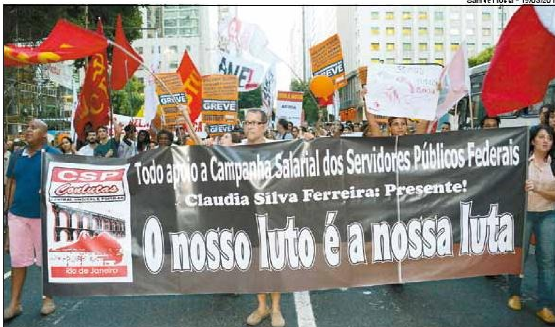
Nas ruas. Manifestantes marcham pela Avenida Rio Branco em defesa dos servidores públicos