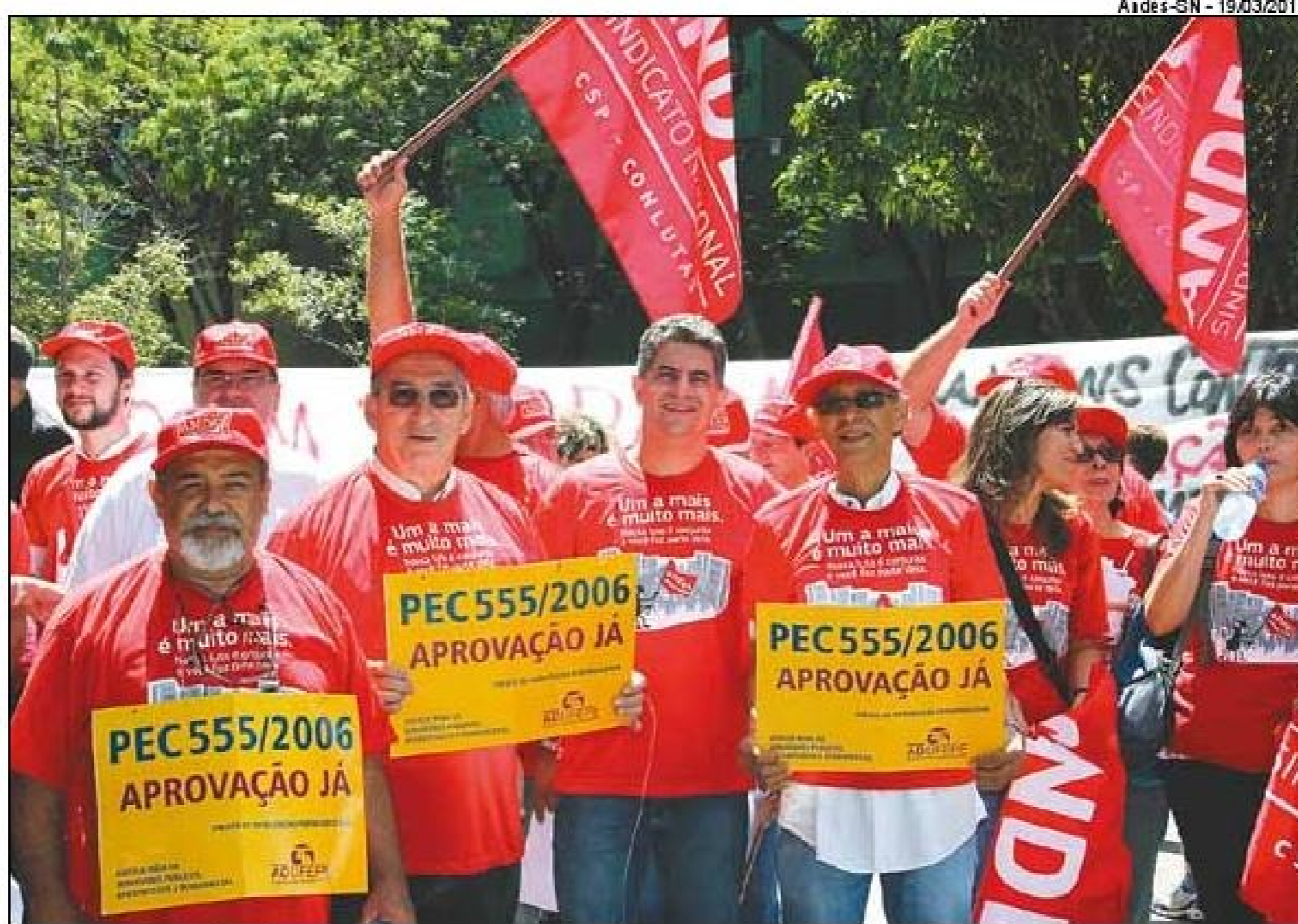
Questão de justiça. Docentes reivindicam o fim da contribuição previdenciária de aposentados

“Reivindicamos um calendário de reuniões para manter a porta aberta e Mendonça respondeu que não há necessidade, pois isso não irá reverter a